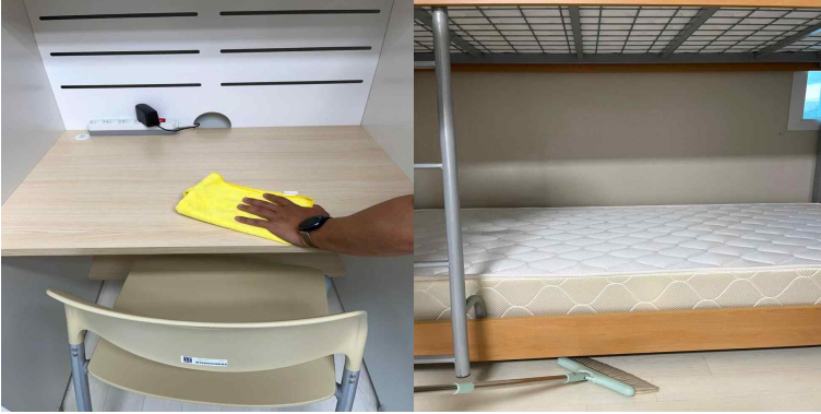
책상, 옷장, 침대 밑 먼지 제거