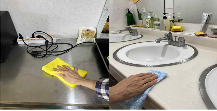
공용조리대 음식물 오염 제거 및 세면대 사용 후 청결 유지