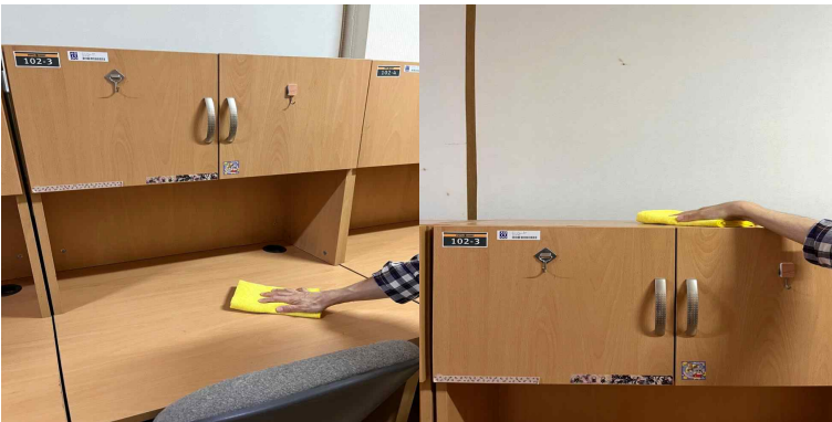
책상, 옷장, 침대 밑 먼지 제거