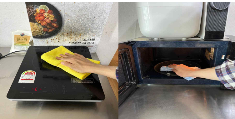
인덕션 및 전자레인지 음식물 오염 제거, 공용식탁 사용 후 청결 유지