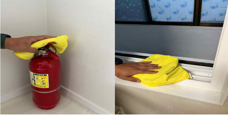
소화기, 창틀 먼지 제거