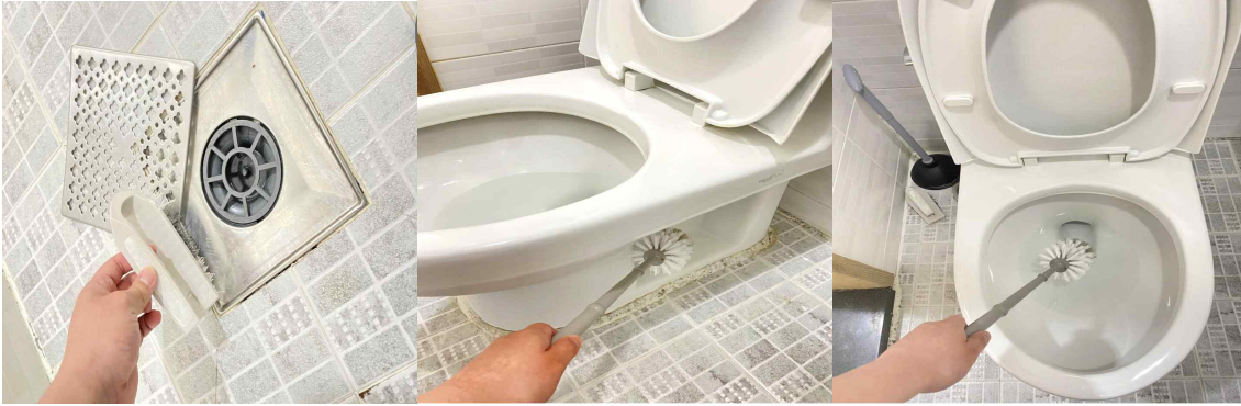
타일 및 타일사이 틈, 배수구 이물질, 변기 내·외부 청소