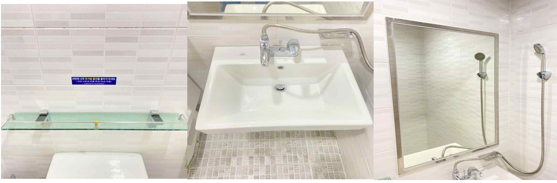
선반, 세면대, 거울 얼룩 제거