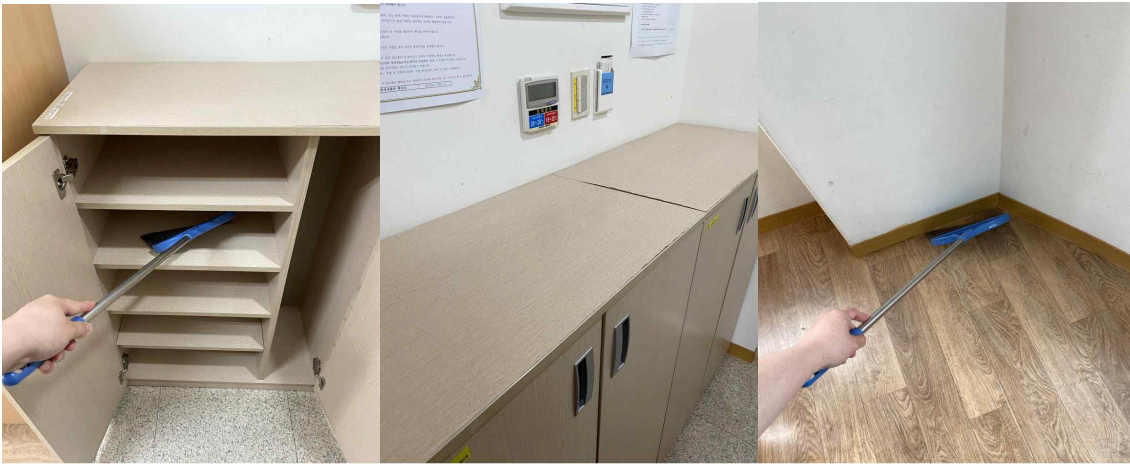
신발장 청소 및 물품 정리, 호실 바닥 먼지 제거